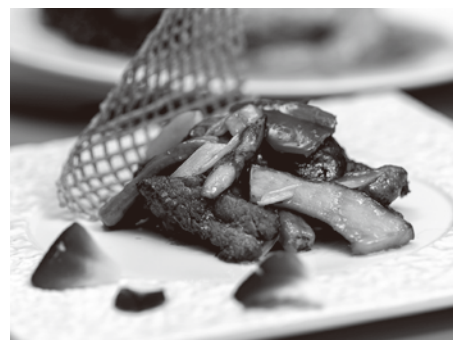
野菜は契約農家直送の素材だけを使う「野菜ソムリエ認定」レストランでもある。