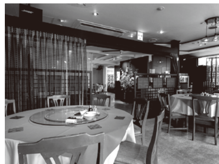
150名の宴会から少人数グループ用まで、ニーズに合わせられる多様な客席。