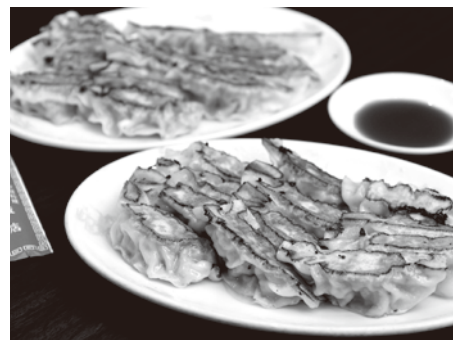
舌触り滑らかなあんは肉感たっぷり。ラードの甘みもあり何個でも食べられる名物の餃子。