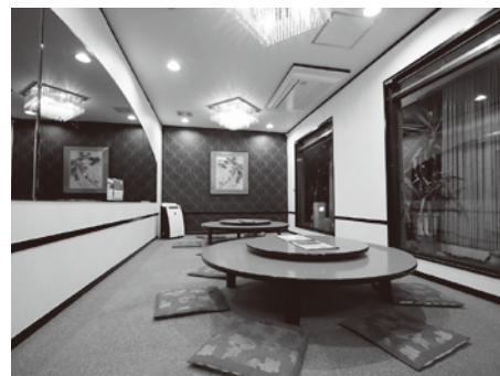
カウンターとテーブルだけの大衆中華から、 本格コースも提供する店へと進化した。