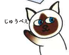
じゅうべえ 大阪国税局 消費税軽減税率制度 イメージキャラクター